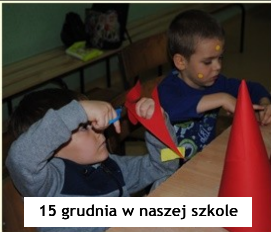
15 grudnia w naszej szkole